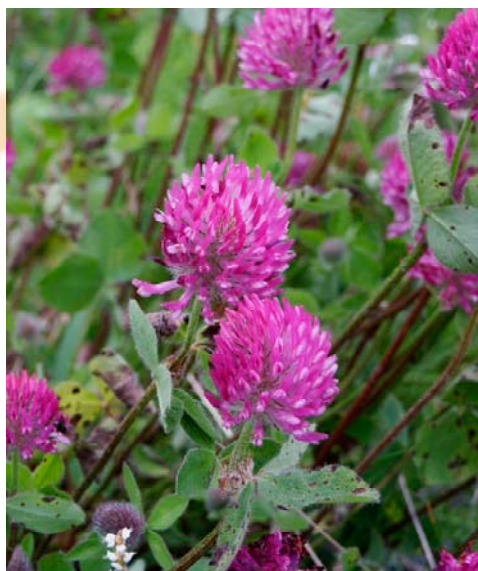
Kløver - brug blomst, stængel og blade fra maj til september.