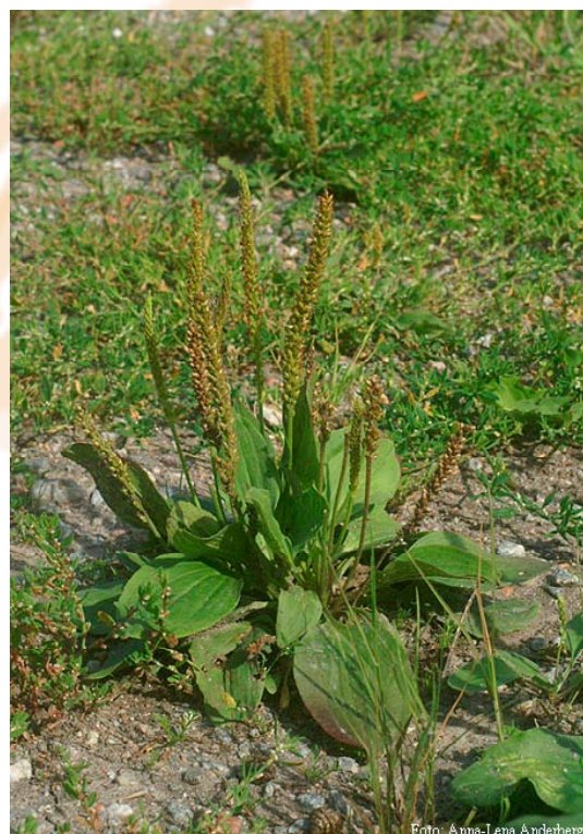
Vejbred - brug blade og frugt fra april til oktober.

Tryk eller rul boller helt flade og steg dem på en hed pande til de er lysebrune på begge sider