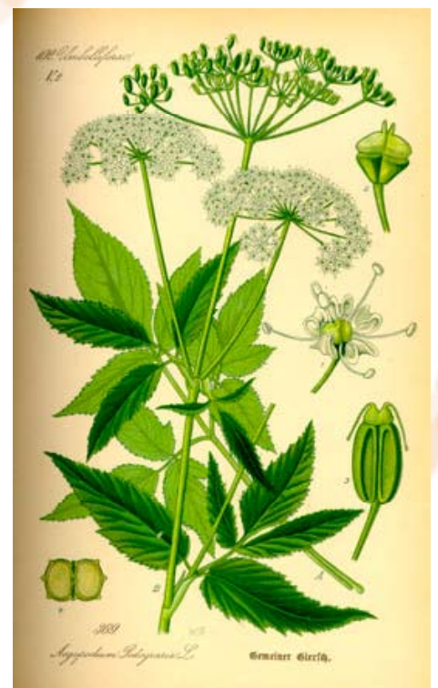
Skvalderkål - brug blade og stængel fra marts til juni.

Erstat ca. 1 dl rasp med 4-500 gram fars