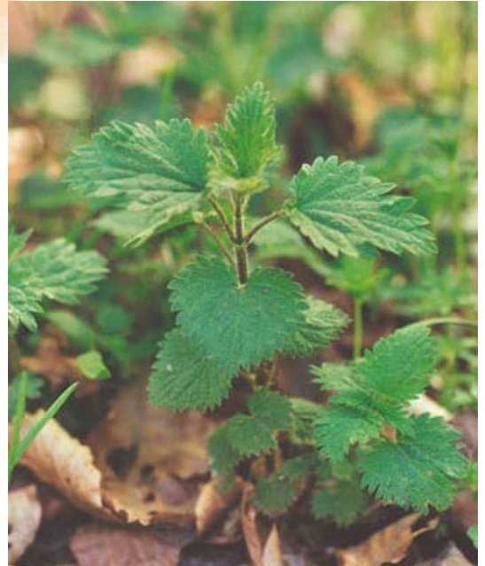
Brændenælde - brug blade og topskud fra marts til september.

Smag til med salt og peber. Fløde kan tilsættes for at gøre den ekstra lækker.