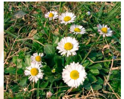
Bellis - brug blomst, stængel og blade fra marts til november.

Fordel blandingen i de udhulede agurker og pynt med Bellis, skovsyre eller andet.