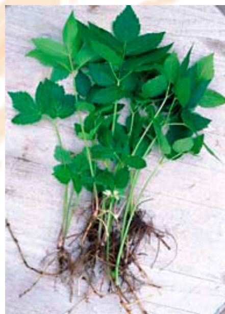
Skvalderkål - brug blade og stængel fra marts til juni.