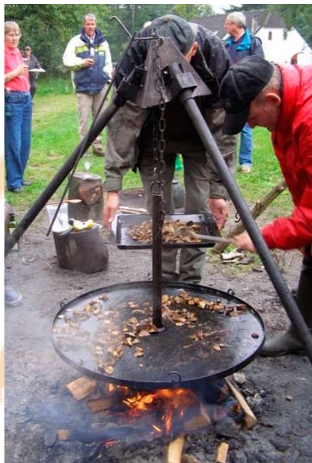
Svampe tilberedt over bål.